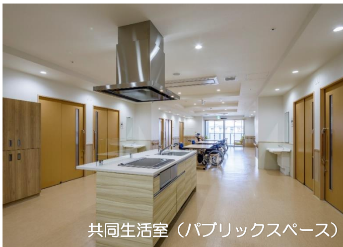
共同生活室（パブリックスペース）

入居のご相談は表面の問い合わせ先まで、ご連絡お待ちしております。*画像は系列施設のイメージです。