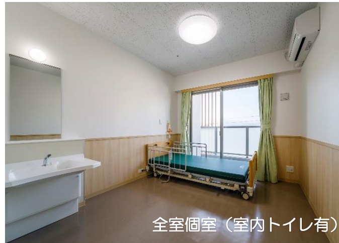
全室個室（室内トイレ有）